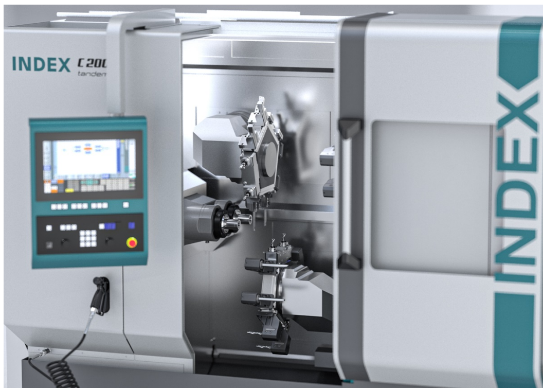
Bild 3: INDEX Produktionsdrehautomat C200 tandem – Doppelte Produktivität